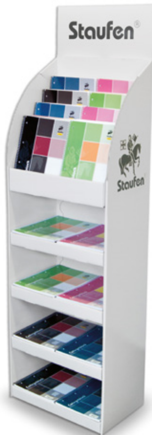
Staufen bietet dem Handel ein attraktives Bodendisplay an, das es ab einer Bestellung von 150 Linea-Collegeblöcken gratis gibt.

Die neuen Kladden Premium unterstreichen ihre Wertigkeit durch den stabilen Book-Cover Umschlag und ihre elegante, hochwertige Aufmachung. Das hierfür verwendete 90 Gramm Premium-Papier macht das Schreiben und Notieren zum angenehmen Erlebnis. Gummiband und Lesezeichen verschaffen dem Produkt einen zusätzlichen Mehrwert. Die Kladden Premium gibt es in zwei Office- und vier Trend-Farben. Für den Abverkauf am Point of Sale bietet Staufen dem Handel ein attraktives Thekendisplay an.