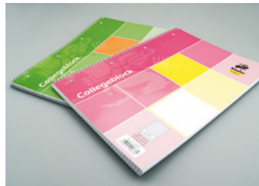
Die Colledgeblöcke Linea präsentieren sich in elegantem Design in jeweils zwei Office- und Trend-Farben.