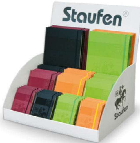
Bei einer Bestellung (bis 31. Mai) von 50 Premium-Kladden gibt es ein hochwertiges Staufen Theken-Display dazu.

Wer den besonderen Collegeblock sucht, wird bei den neuen Collegeblöcken Premium von Staufen sicherlich fündig werden. Müheloses Aufschlagen der Seiten und gezieltes Heraustrennen der Seiten sind Eigenschaften, die diese Collegeblöcke so nützlich machen. Dem hochwertigen Anspruch folgend, präsentiert sich dieses Produkt mit 90 Gramm Premium-Papier sowie einer stabilen 0,9 Millimeter Spirale. Besonders augenfällig ist das elegante, fühlbare Premium-Design in vier Office- und vier Trend-Farben. Staufen bietet die Collegeblöcke Premium in acht Farben in Fünfer Verpackungseinheiten an. Die Farben sind aber auch einzeln bestellbar. Staufen bietet dem Handel ein attraktives Bodendisplay an, das es ab einer Bestellung von 150 Premium-Collegeblöcken gratis gibt. Auch diese Aktion ist gültig bei einer Bestellung bis zum 31. Mai.